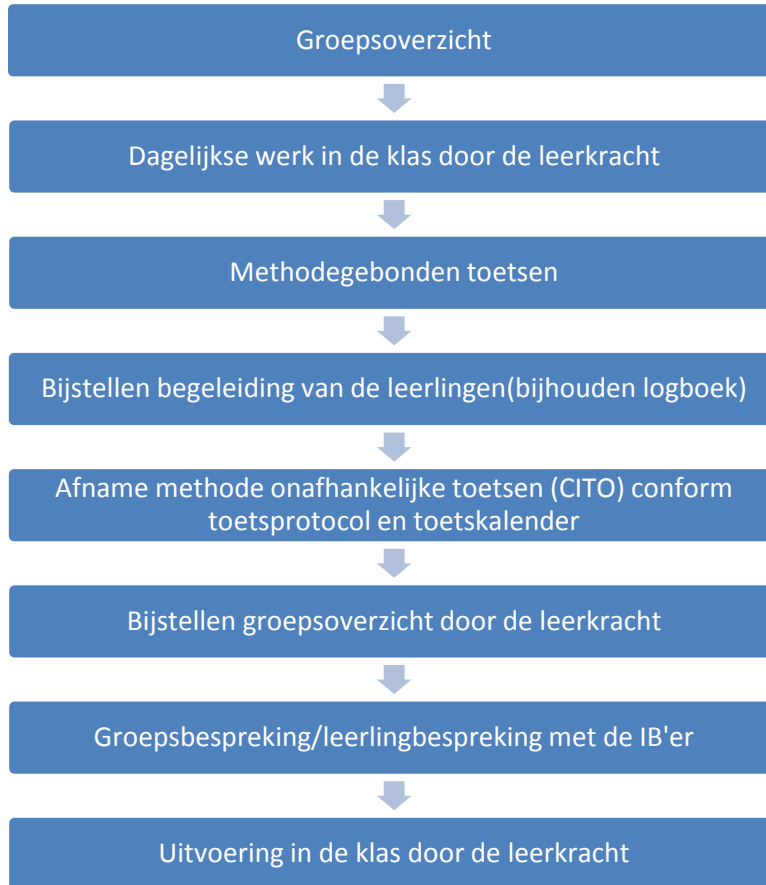
Figuur 2. Overzicht ondersteuningsstructuur

andere, beter passende plaats zoeken. Dat kan ook het speciaal (basis)onderwijs zijn. Ook hierin worden ouders tijdig meegenomen.